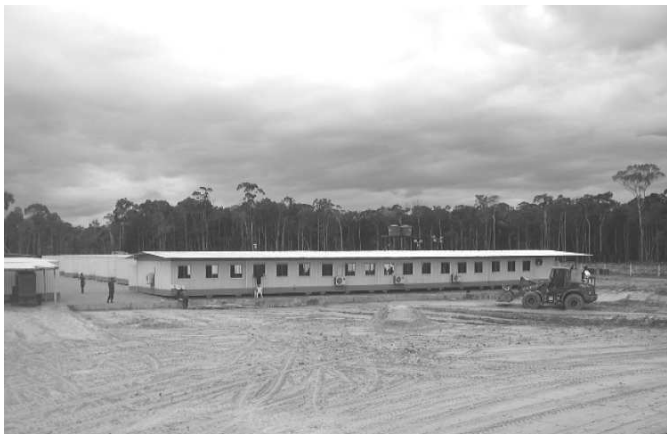
Foto 5 - Op BERURI - Área de estacionamento de Dst Eng (BR-319/AM)

Outro aspecto importante é o planejamento da área de estacionamento da tropa. Muitas vezes é possível o acantonamento, todavia em outras oportunidades há necessidade da construção de instalações. Como as operações de engenharia de construção tendem a requerer mais tempo para a execução dos trabalhos, aspectos como instalação de rede de esgoto, tratamento e suprimento d'água e fornecimento de energia elétrica