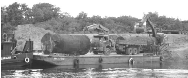
Foto 4 - Op BERURI - Desembarque de tanques para o armazenamento de insumos asfálticos para usina de asfalto – (BR-319/AM)

O planejamento logístico é o aspecto mais sensível para as operações de engenharia de construção. Considerando a dimensão dos trabalhos a serem executados,