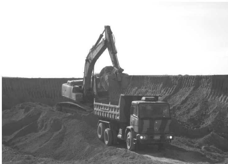
Foto 2 - Op LETHEN – Escavação e carregamento de material para trabalho de pavimentação na Guiana

Na guerra, na fase de emprego, correspondem às mesmas operações de engenharia de construção realizadas em tempo de paz, contudo com destinação prioritária de atender às demandas das tropas apoiadas (o que não significa que os trabalhos executados não atendam também aos civis) visando à vitória.