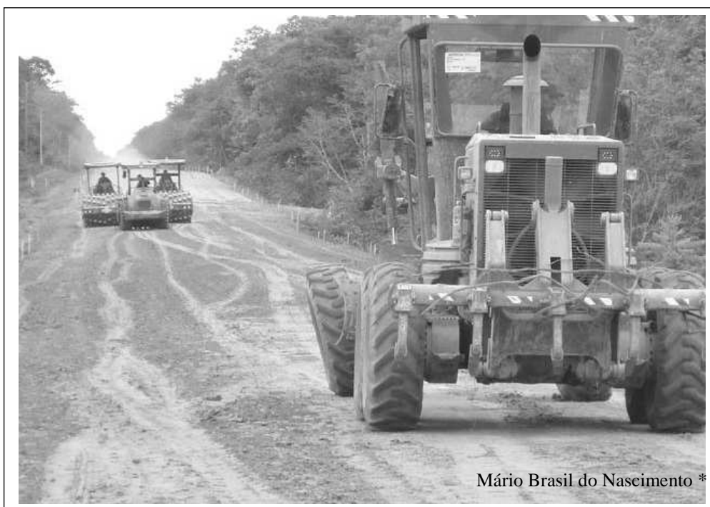
Foto 1 - Op BERURI - Execução de trabalho de pavimentação (sub-base) na BR-319/AM

“As operações de engenharia de construção são um excelente laboratório para validação ou para o aperfeiçoamento da doutrina, não só a específica de Engenharia, mas também a de Logística. Isso ocorre, normalmente, em virtude do longo tempo de duração de emprego da tropa no terreno e, conseqüentemente, do período de observação e de coleta de dados.”